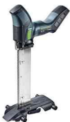
Taglierina per pannelli in fibra.