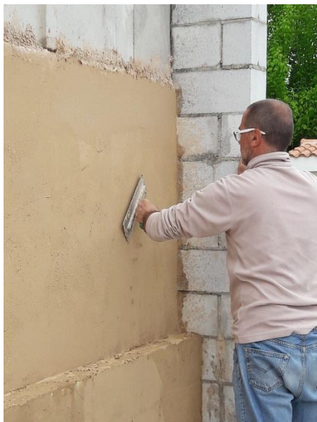
FOTO B: Passaggio di frattazzo su stucco esterno termoisolante CANAPASTUCK.

Applicazione di CANAPASTUCK come intonachino di rasatura deumidificante da interno ed esterno. Posa in opera manuale.