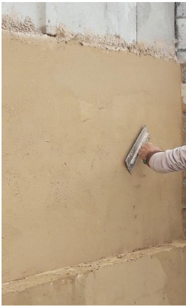
FOTO B: Passaggio di frattazzo su stucco esterno termoisolante CANAPASTUCK.

Applicazione di CANAPASTUCK come intonachino di rasatura deumidificante da interno ed esterno. Posa in opera manuale.